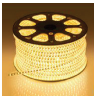
bílá teplá (3000K)