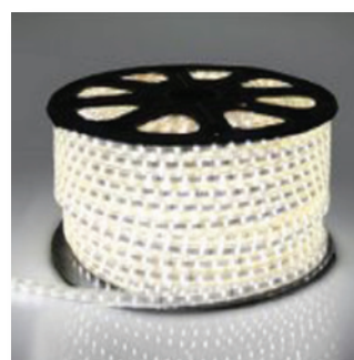
bílá studená (6500K)